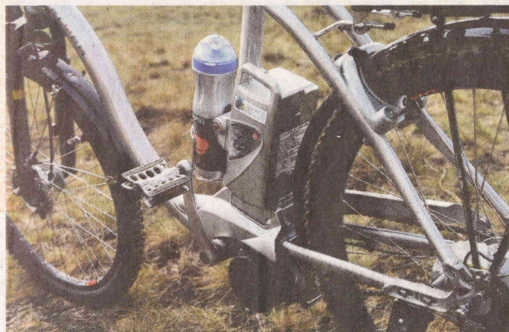
De Flyer, een elektrisch aangedreven terreinfiets.

Fietssafari over de Veluwe, tot oktober, ma-vrij: 40 euro per persoon; in het weekend en tijdens vakanties: 45 euro, exclusief lunch. Minimaal twee en maximaal vijf deelnemers. Meer informatie en reserveringen via de website www.veluwe-fiets-safari.nl